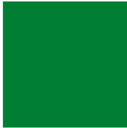
Verde Pasto RAL 6010