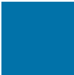
Azul Cielo RAL 5015